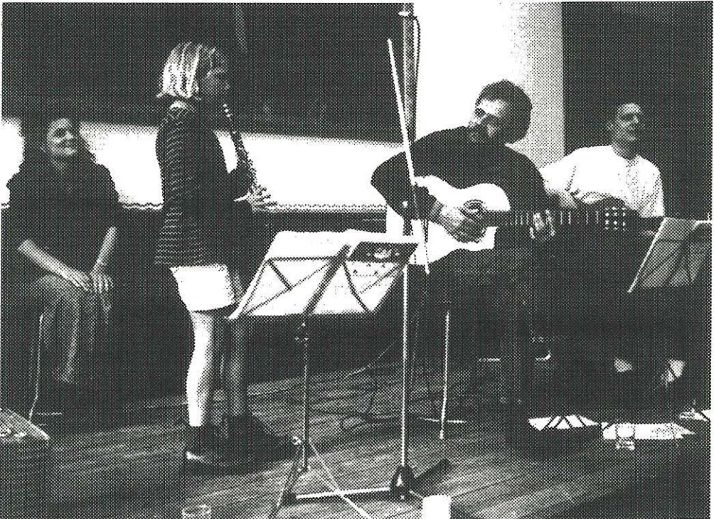
Sigrids Dagbog. Generalprøve. Vallekilde Højskole. 1994.